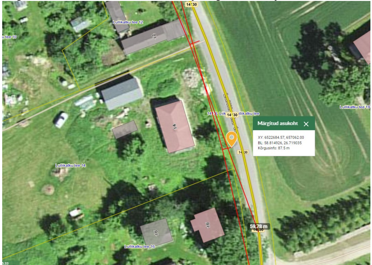
Joonis 1. Ristumiskoha asukoha tähistatud oranži nupuga. Nähtavuskolmnurgad tähistatud punaste joontega.